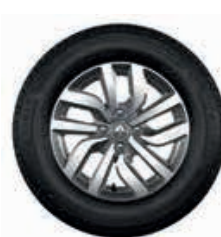
Premia 15" diamantado