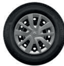
Embellecedor Magiceo 15"