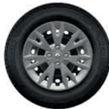
Embellecedor Eptius 15"